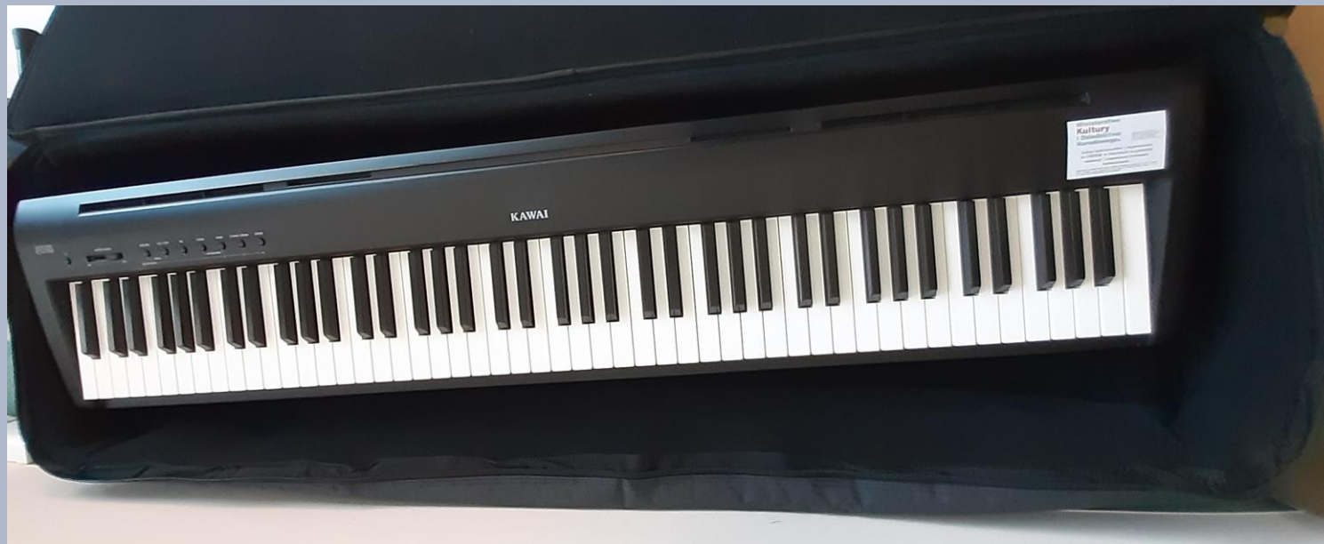
Pianino cyfrowe typu KAWAI ES110